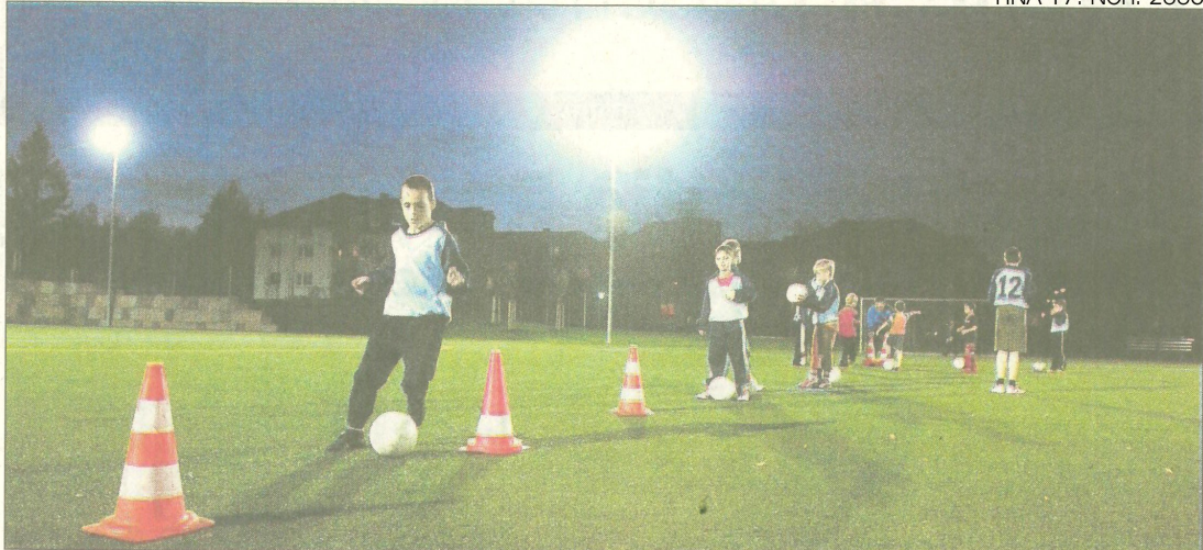
Sie waren unter den Ersten: Die Fußballer der E-Jugend des SV Hermannia trainierten am Mittwoch als eine der ersten Mannschaften auf einem der neuen Kunstrasenplätze des Nordstadtstadions. Flutlichtstrahler machen das Training auch am Abend möglich.